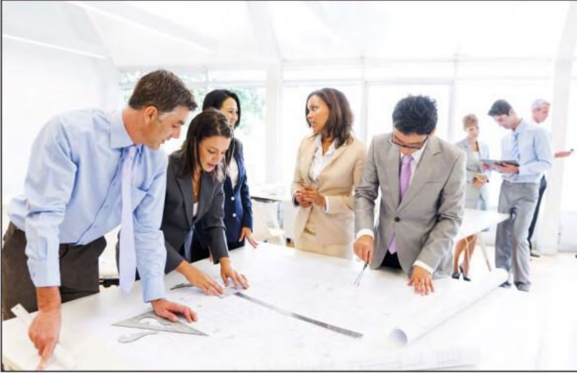
Fizibilite çalışmalarından önce mutlaka ön araştırmanın yapılması gerekir.

İş kurma düşüncesi ile birlikte kesin olarak işin kurulmasına kadar kuruluş çalışmaları adı verilen çalışmaların yapılması gerekmektedir. Ön araştırmalar olarak da ifade edilen bu çalışmalar, kurulmak istenen işletmenin önemine ve özelliklerine göre değişen sürelerde gerçekleştirilir.