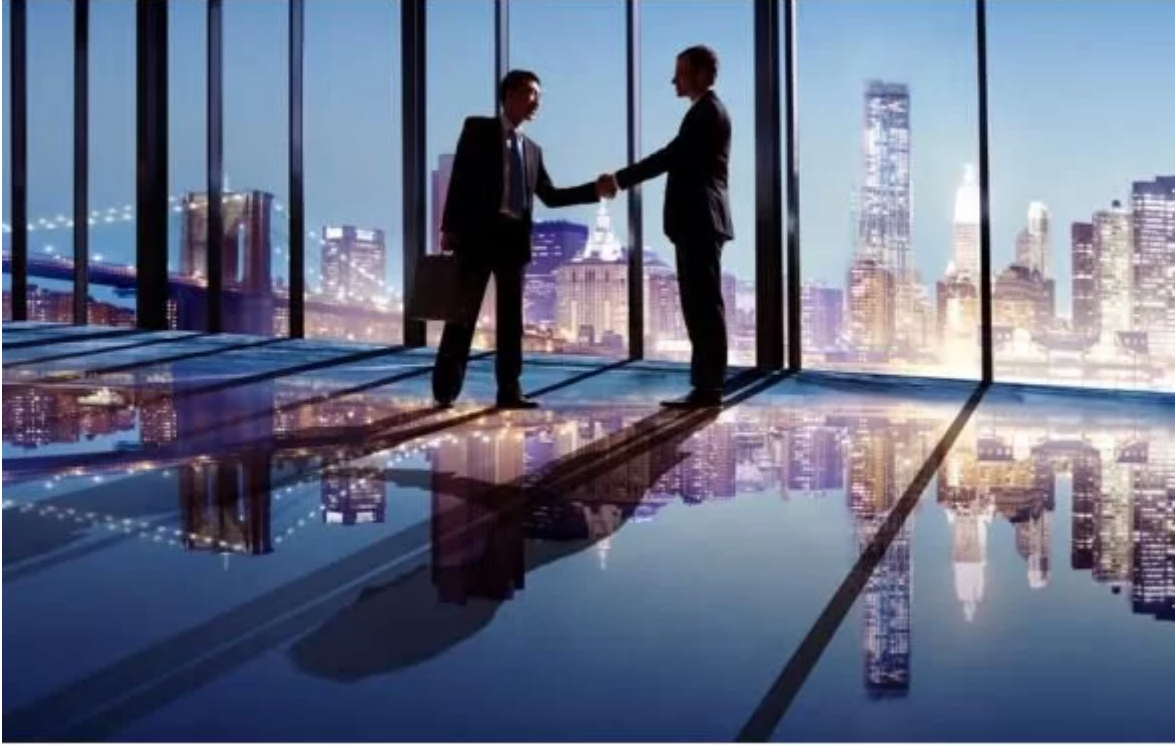
Yatırım kararı alma, fizibilite etüdünün son aşamalarındandır

Teknik analiz unutulmamalıdır: Bu analiz aşaması genel olarak düşünülen projenin teknik olarak yapılabilirliğini inceleme ve araştırmayı amaçlar. Eğer projenin gerçekleştirilmesi için alternatif teknolojiler varsa bunların değerlendirilmesi ve uygun olan teknolojinin seçilerek imalat için gerekli sabit sermaye miktarlarının tahmin edilmesi de bu analiz kapsamındadır. Genelde bu analiz aşaması projenin imalat boyutunu oluşturması nedeniyle teknik ağırlıklı olmasına karşın, ekonomik boyutu da son derecede önemlidir. Bu nedenle yalnızca bir mühendislik işi olarak görülmemelidir. Projenin teknik boyutlarının etkin bir biçimde incelenmesi ve düzenlenmesi, ilişkili ekonomik boyutların sağlıklı bir biçimde saptanmasına bağlıdır. Teknik analiz sonucu eğer proje teknik olarak yapılabilir değilse ya yeni teknolojik olanaklar yeniden araştırılmalı ya da projeden vazgeçilmelidir.